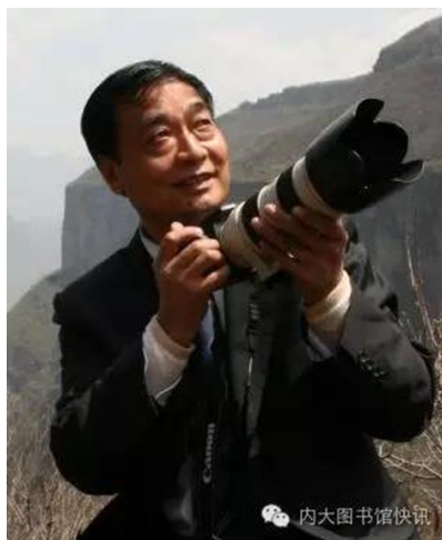
国家一级摄影师 张海勇先生

2016年6月7日下午14:00，中华环保联合会、内蒙古自治区环境保护厅联合主办，内蒙古大学图书馆协办的《张海勇：环境风光摄影讲座》圆满结束。张海勇，男，1958年10月出生，中共党员，研究生学历，高级经济师。国家一级摄影师。中国摄影家协会会员，中国环保志愿者，中国金融文联文艺志愿者，中国金融摄协文艺志愿者。中国著名太行风光摄影家。中国平遥国际摄影大展优秀风光摄影师获得者。河南省艺术摄影学会副主席，中国金融摄影家协会理事，中国农业银行摄影家协会副主席。