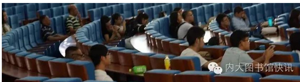
被精彩讲座吸引的老师 and 同学们