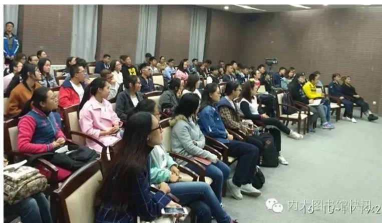
同学们在认真聆听