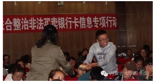
讲座现场气氛浓烈