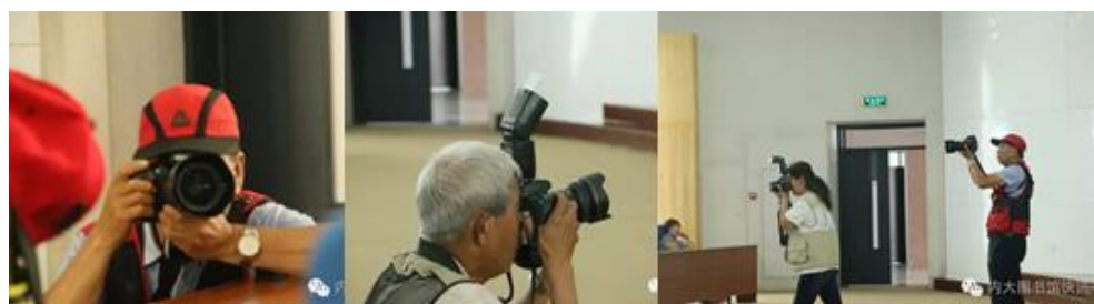
部分摄影爱好者在讲座现场