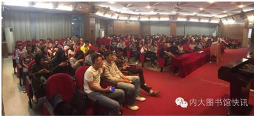
精彩讲座同学们报以热烈掌声