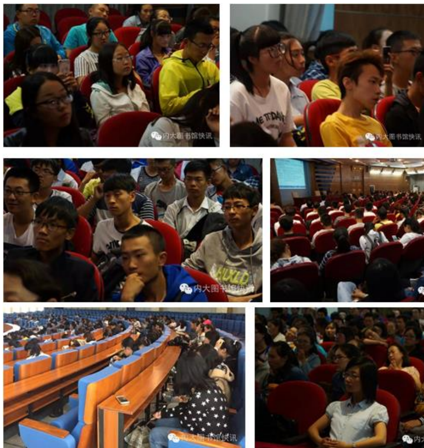
下雨了，阻挡不住我们挺讲座的热情