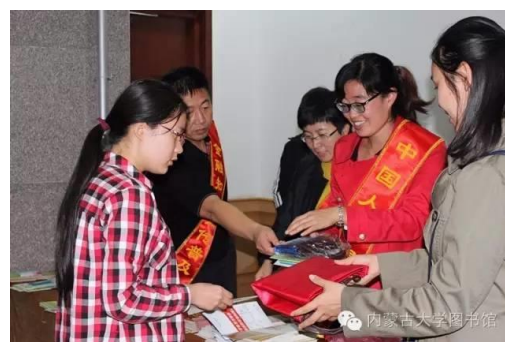
会前工作人员向内蒙古大学图书馆读者发放“金融知识普及月”活动宣传资料