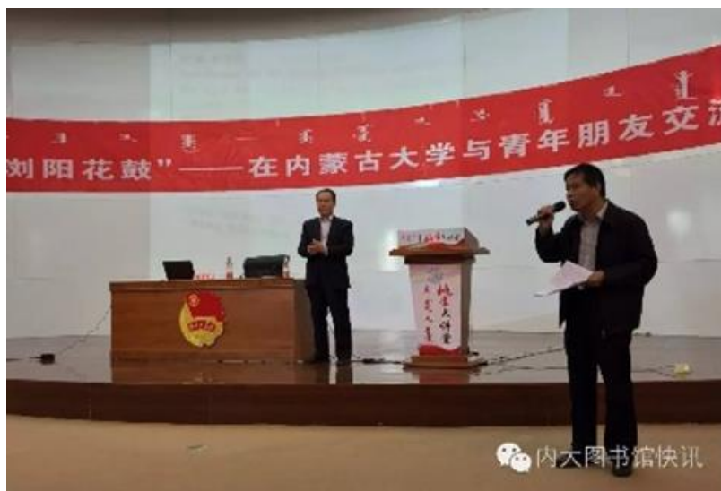
内蒙古大学副校长张吉维教授