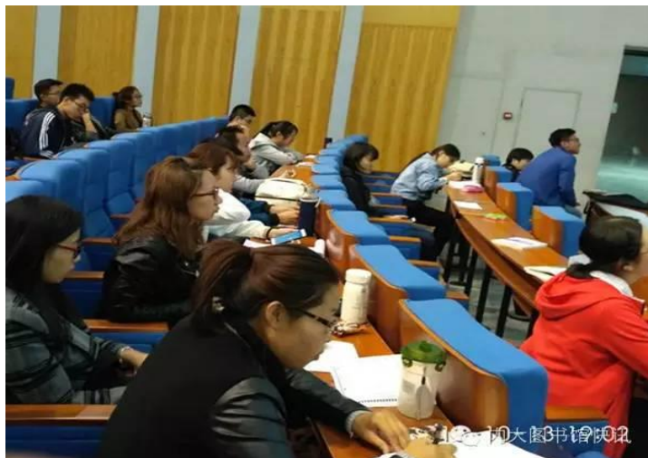
考研学子认真记录