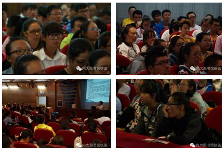
靠谱的讲座，用心听